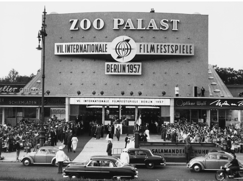
Der Berliner Zoo Palast kurz vor der Eröffnung der VII. Internationalen Berliner Filmfestspiele am 21. Juni 1957.