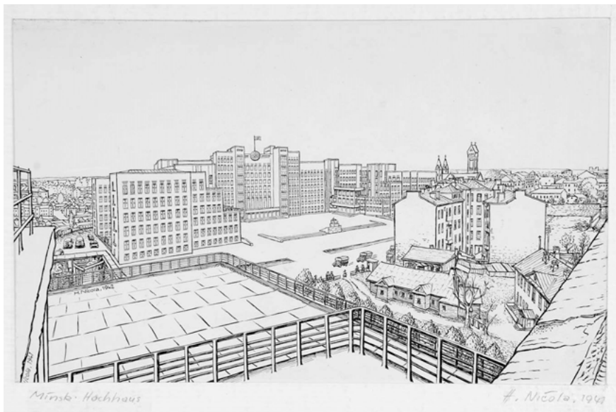
Postkartenmotiv Minsk, Hans Nicola (1941).