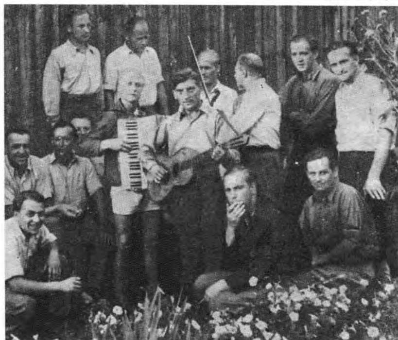
Beide Abbildungen aus der Kriegsgefangenenzeitung „Die Brücke“, Nr. 25, August 1994