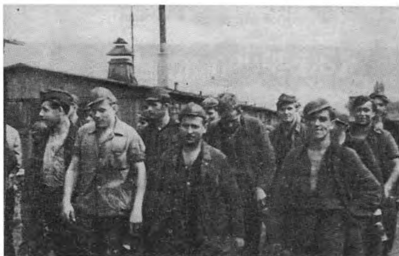
Kriegsgefangene auf dem Weg zum Bergwerk