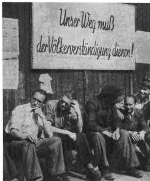
Im Kriegsgefangenenlager in Warschau kurz vor der Entlassung