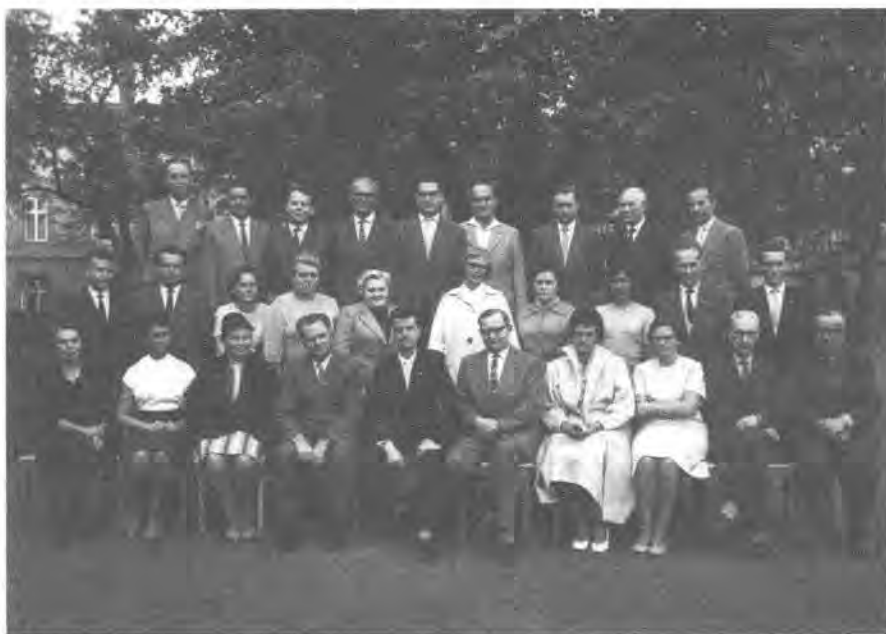
Kollegium der Goethe-Oberschule Schwerin, 1958