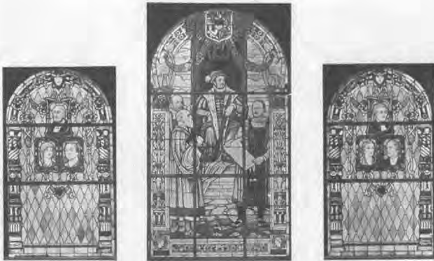
Glasfenster in der Aula des Gymnasiums Fridericianum Schwerin, Stiftung ehemaliger Schüler zum 350-jährigen Jubiläum des Gymnasiums im Jahr 1903, links: Homer, Vergil, Horaz, Mitte: Herzog Johann Albrecht I. von Mecklenburg, rechts: Lessing, Schiller, Goethe