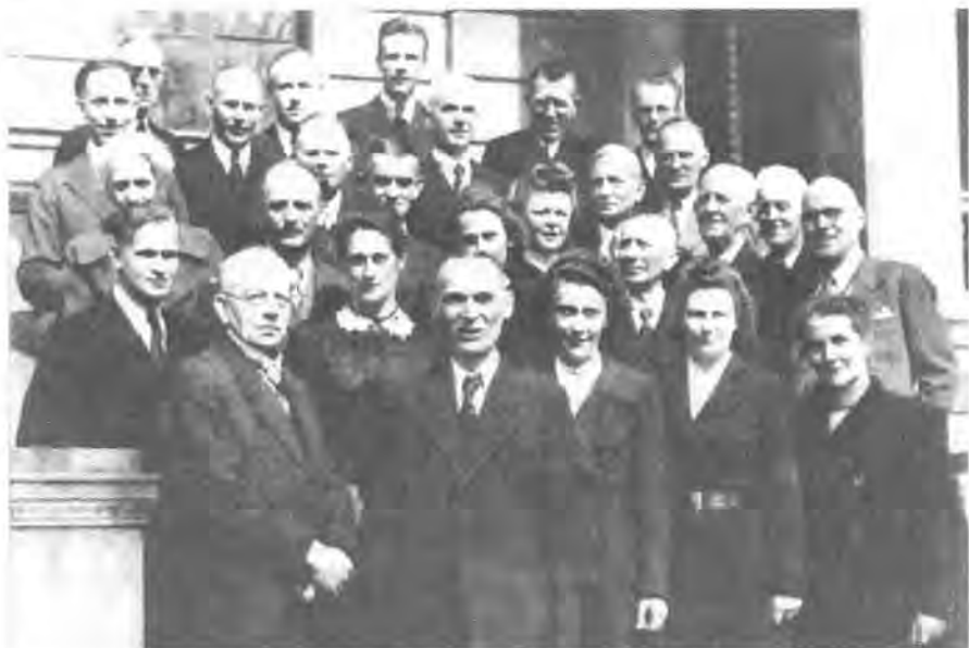
Kollegium der Großen Stadtschule Rostock, 1949