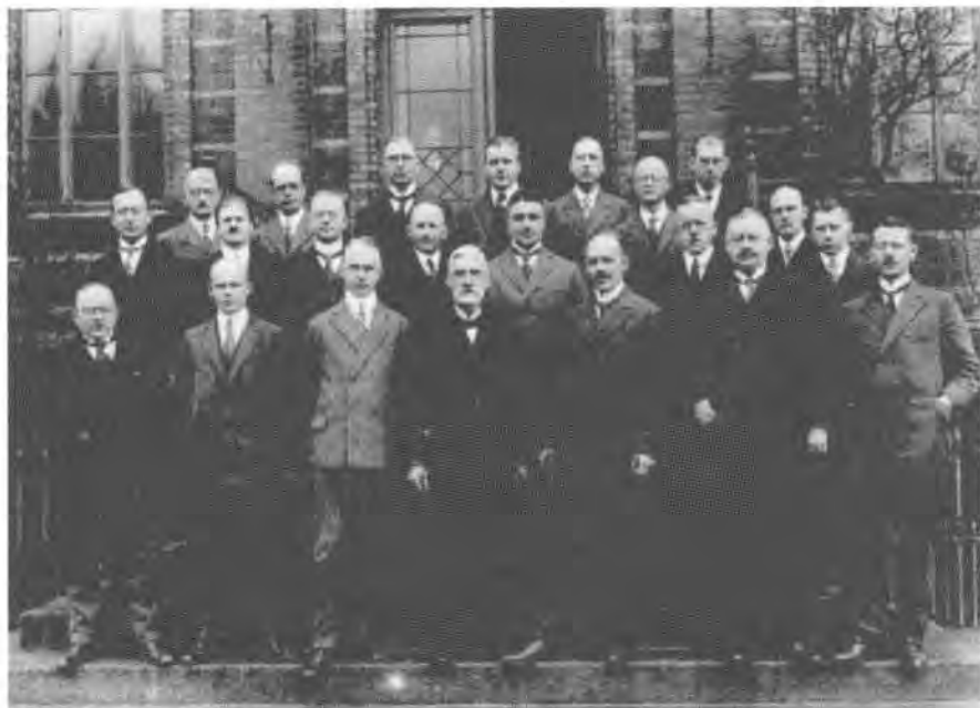
Lehrerkollegium Ostern 1928.