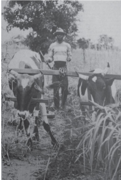
Abbildung 3: SOAS, CA/J/4. Bebilderung des Artikels „Ghana. Ox-plough revolution“, in: Grass Roots. Examples of Christian Aid's work in developing countries, 1976.

Die Visualisierungen versinnbildlichten die Veränderungen im emotionalen Zugriff auf die „Dritte Welt“, die mit den Selbsthilfe-Ansätzen einhergingen. Statt Mitleid zu erregen, wie im Fall des ‚hungernden Kindes‘, stand nun im Vordergrund, Sympathie oder gar Bewunderung hervorzurufen. Die bildliche und narrative Darstellung der Entwicklungsländer wiesen somit die Charakteristika einer Heroisierung auf. Sie zeigten hart arbeitende Menschen, die versuchten, ihr Schicksal in die eigene Hand zu nehmen. Diese hart arbeiteten Durchschnittsmenschen aus der „Dritten Welt“ avancierten quasi zu den neuen Helden der NGOs. 273