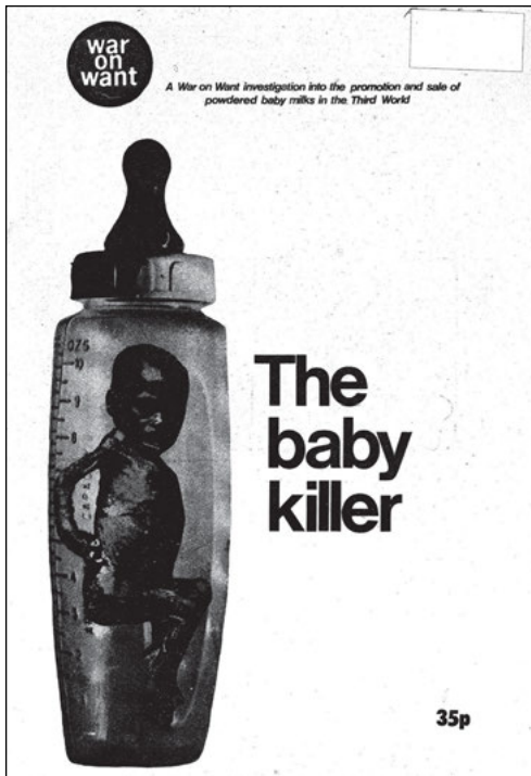
Abbildung 1: SOAS, WOW/254/02433. Mike Muller, The Baby Killer . A War on Want investigation into the promotion and sale of powdered baby milks in the Third World, 1974. Titelbild.

Diese drastischen Schilderungen wurden zudem mit schockierenden Fotografien visualisiert.