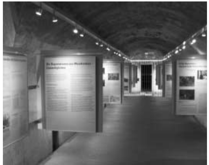
Die Sonderausstellung »Wege in die Vernichtung« im neuen Raum für Wechselausstellungen

Durch die Erweiterung des zugänglichen Teils der Bunkeranlage steht eine große Kaverne für Sonderausstellungen zur Verfügung. Diese wurde mit Beleuchtung und einem flexiblen Tafelsystem für Wechselausstellungen eingerichtet. Am 12. Oktober 2006 wurde hier mit einem Vortrag von Dr. Edith Raim im Rahmen des 8. Obersalzberger Gesprächs die 1. Winterausstellung der Dokumentation Obersalzberg eröffnet. Bis 31. März 2007 ist die Ausstellung »Wege in die Vernichtung. Die Deportation der Juden aus Mainfranken 1941–1943« zu sehen, die das Institut für Zeitgeschichte in Zusammenarbeit mit der Generaldirektion der Bayerischen Archive und dem Staatsarchiv Würzburg erarbeitet hat. Künftig sollen jedes Jahr in den besucherschwachen Wintermonaten Sonderausstellungen gezeigt werden, die einzelne Themen der Ausstellung vertiefen und dadurch noch zusätzliches Publikum generieren.