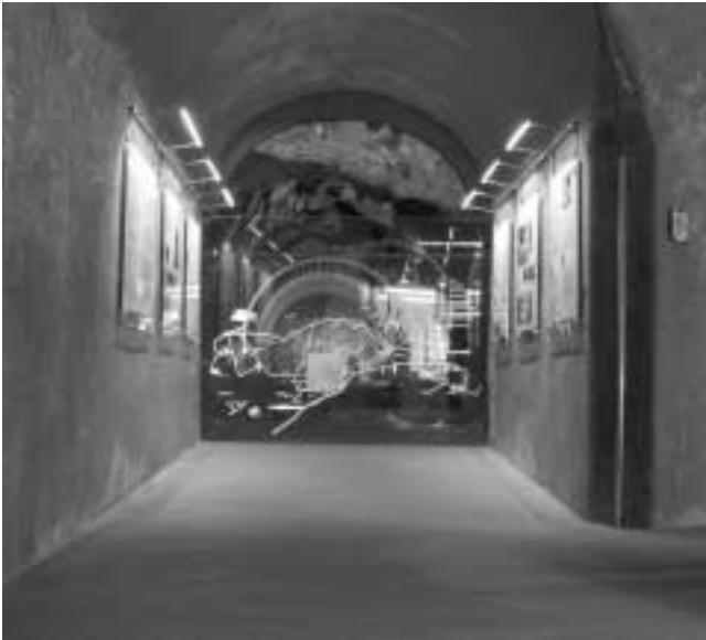
Neue Ausstellungstafeln zur Geschichte der Bunkeranlage

Nachdem im vergangenen Jahr einem vielfach von Besuchern, insbesondere auch von Politikern, geäußerten Wunsch entsprechend der für die Ausstellungsbesucher zugängliche Bunkerbereich bis zum Zugang vom früheren Platterhof (mit MG-Stand) erweitert wurde, konnte 2006 aufgrund neuer Forschungen eine neue, zusätzliche Ausstellungseinheit über Funktion und Geschichte der Bunkeranlage am Obersalzberg erarbeitet werden. Gleichzeitig wurden die einzelnen Räumlichkeiten des Bunkers mit ihren früheren Funktionen neu beschildert. Ansonsten war in der Ausstellung aufgrund personeller und finanzieller Engpässe lediglich die Durchführung unumgängliche Reparaturen möglich.