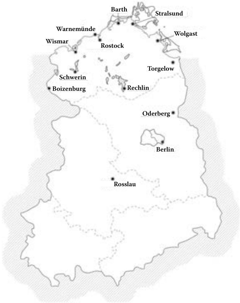
Abbildung 1: Standorte der ostdeutschen Werftindustrie