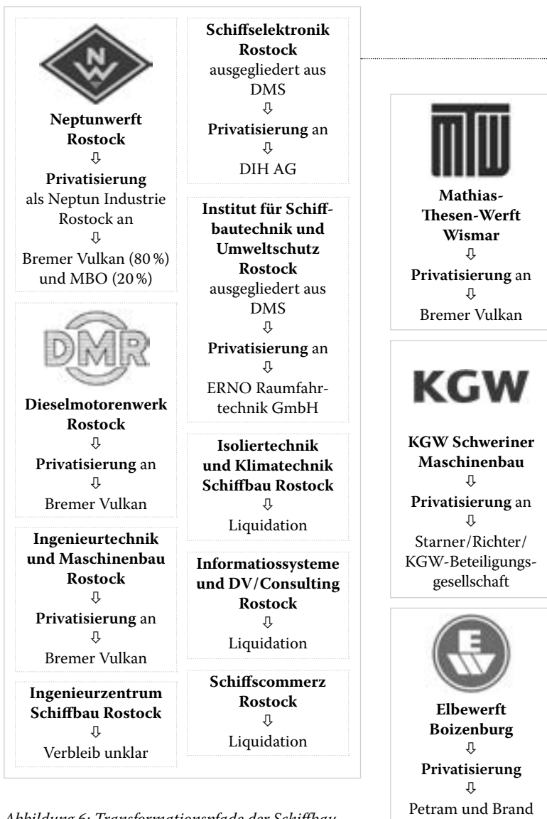
Abbildung 6: Transformationspfade der Schiffbau- betriebe und Zulieferer in Mecklenburg-Vorpommern zum Ende des Jahres 1994