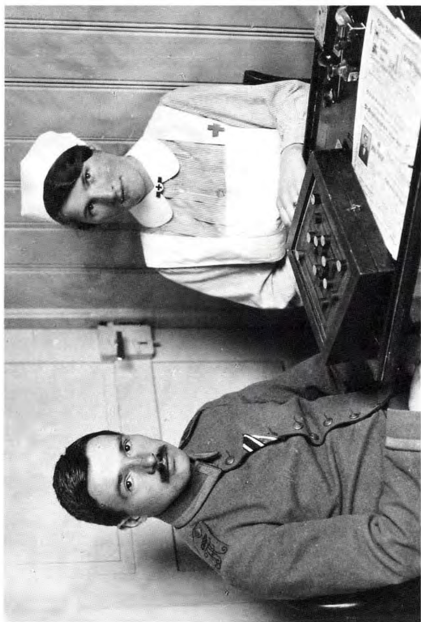
5. Im Lazarett in Ellwangen