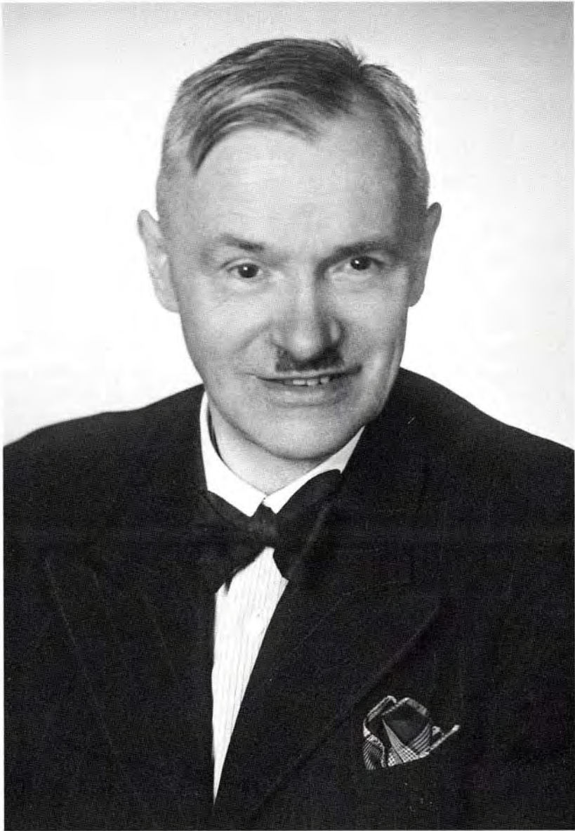
7. Porträt Ende der 30er Jahre