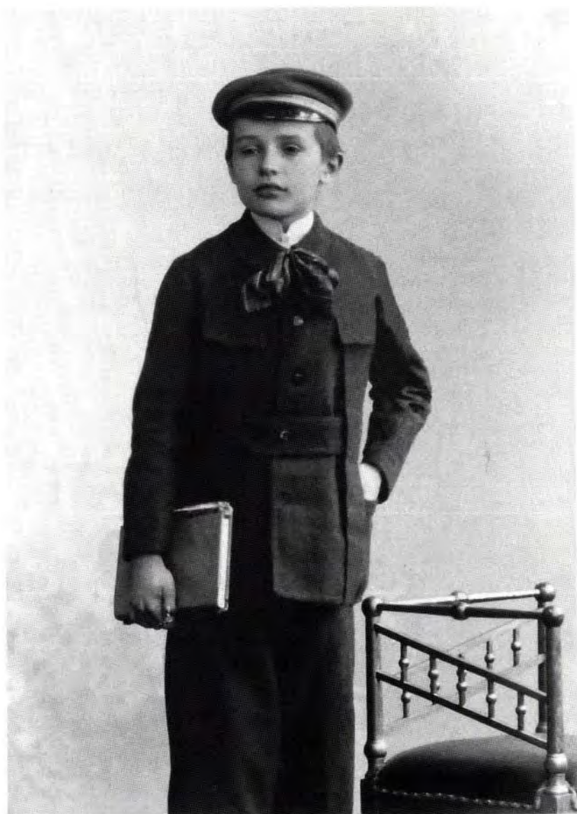
1. Aus der Schulzeit