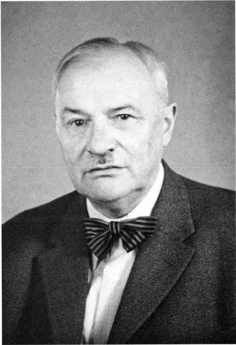
8. Als Professor in München