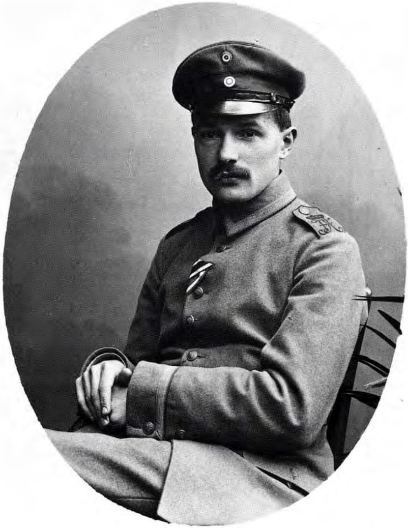
4. Soldat im Weltkrieg