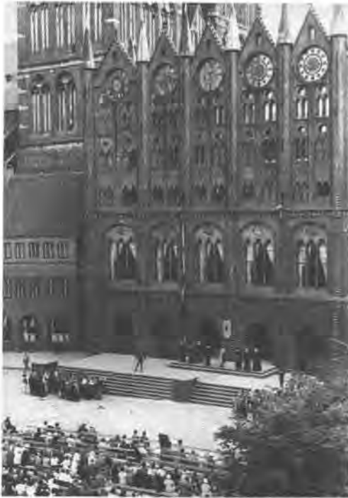
Marktfestspiel vor historischer Kulisse, 1934