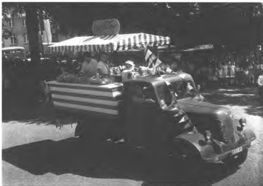
HO-Fix, Schauwagen auf dem Festzug 1959 (Stadtarchiv Stralsund, Fotoslg., VIII Ls-027).