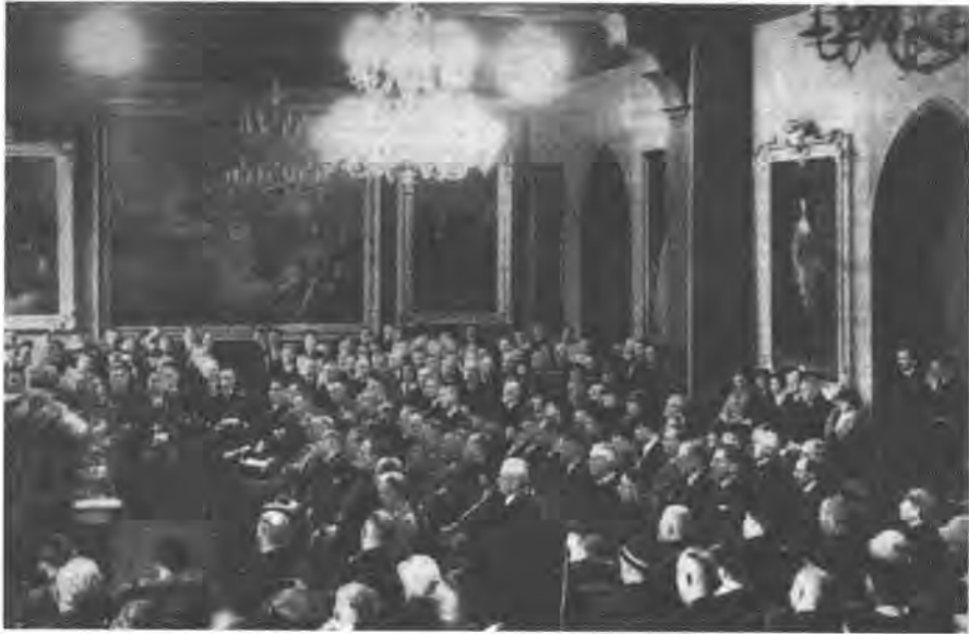
Festveranstaltung am 31. Oktober 1934 (Stralsunder Tageblatt, Nr. 206, 1.11.1934).