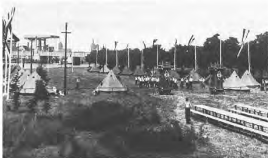
„Junger Norden“ auf dem Dänholm

(aus Broschüre: Junger Norden. Erstes deutsch-schwedisches Gemeinschaftslager der Hitler-Jugend 1937. Rückblick und Ausblick. Stralsund, im Mai 1938, hrsg. v. der Stadt Stralsund.)