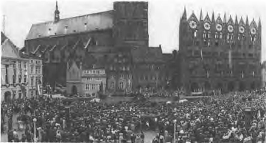
Eröffnungskundgebung zur 725-Jahrfeier, 1959.

wie vor war die Traditionsbindung an den Raum stark ausgeprägt, wie die Ansprache Max Fanks zur Eröffnung des FdJ-Jugendkongresses am 30. Mai 1948 auf eben jenem Alten Markt zeigte. Fank bemühte eine lange Traditionslinie der Demokratie, von den frühesten Vorläufern im 14. Jahrhundert bis in die jüngste Vergangenheit vor 1933, die alle mit diesem Platz in Verbindung stünden, „der durch die Jahrhunderte hindurch der Kundgebungsplatz einer freiheitsliebenden Stadtbevölkerung gewesen ist und der Zeuge [...] des Kampfes des Fortschritts gegen den Rückschritt.“ 78