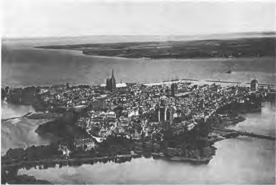
Stralsunds Altstadt in den 1930er Jahren.

(aus Broschüre: Junger Norden. Erstes deutsch-schwedisches Gemeinschaftslager der Hitler-Jugend 1937. Rückblick und Ausblick. Stralsund, im Mai 1938, hrsg. v. der Stadt Stralsund)