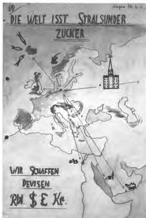
Plakatentwurf der Stralsunder Zuckerfabrik für den Festzug 1959 (Stadtarchiv Stralsund, Rep. 54/486).

den moderne Frisuren zeigen“. 275 Mit deutlich agitatorischerem Anstrich versah die Abteilung Handel und Versorgung des Rates der Stadt ihr Präsentationskonzept diverser HO-Verkaufsstellen und Gastronomiestätten. Im Rahmen der HO-Gaststätten wollte sie eine Gegenüberstellung „Westdeutschland – DDR“ inszenieren. Für den Westteil sollte „eine Gruppe Jugendlicher (Halbstarke) in entsprechender Aufmachung, in einer Kaschemme unter dem Motto“ auftreten: „Gaststätten in Westdeutschland – Brutstätten des Militarismus“, ein Bearbeiter korrigierte dies in „Stätten der amerikanischen Unkultur“. Die DDR-Situation sollte durch eine saubere Milchbar symbolisiert werden. 276 Die „Milchbar“, in der nur nicht-alkoholische Getränke serviert wurden, sollte auch Vorbild für das allgemeine Erscheinungsbild der städtischen Gastronomie im Rahmen der Feierlichkeiten sein. „Der Stand der Gaststättenkultur“, so eine Vorlage für die Sitzung des Büros der SED Kreisleitung Stralsund am 23. Mai 1959, „ist ein Maßstab der Beurteilung der sozialistischen Umgestaltung unserer Republik. Darum muss mit aller Energie die Verbesserung der Gaststättenkultur erreicht werden.“ Dabei ging es nicht nur um die qualitative Verbesserung des Angebotes und der baulichen Ge-