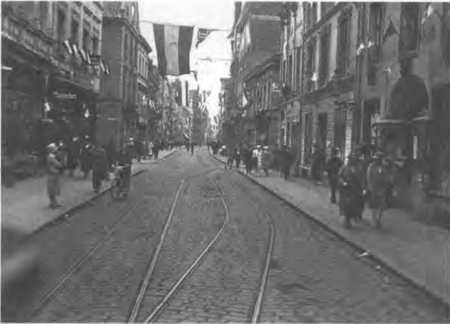
Die „nationale Stadt“ flaggt schwarz-weiß-rot.

wurde zwar von konservativem Bürgertum und Magistrat, die sich in einer Kontinuitätslinie zur Bürgerschaft des glorreichen hansischen Stralsunds des Mittelalters wähten, als „ihr“ Platz vereinnahmt, doch auch republikanische und sozialdemokratische Organisationen zeigten an diesem Ort Präsenz. Es war ein unübersehbares Zeichen des Systemwandels, dass am 1. Mai 1919 erstmals die Arbeiterschaft Stralsunds auf dem Alten Markt die Abschlusskundgebung ihrer Maidemonstration abhielt. 61 Allein die Tatsache, dass das Verlagshaus des seit Januar 1920 erscheinenden sozialdemokratischen „Vorpommer“ seine Adresse in direkter Nachbarschaft zum Rathaus an diesem Platz hatte, war von hoher Symbolkraft. Dass dieses Verlagshaus republikanisch flaggte, war zudem ein Stein des Anstoßes, wie überhaupt die fahnenmäßige Ausgestaltung des Platzes bei öffentlichen Veranstaltungen ein immer wiederkehrender Streitpunkt war. Nationalistische Organisationen wie der „Stahlhelm“ drohten bei festlichen Anlässen mit Verweigerung, sollte schwarz-rot-gold geflaggt werden 62 , und genau auf das Zeigen dieser Fahne legten wiederum die Verfechter der demokratischen Republik Wert. Als der sozial-liberale Gewerkschaftsbund der Angestellten (GdA) vom 19. bis zum 21. Juli 1924 in Stralsund seinen Reichsjugendtag abhielt, zollte das sozialdemokratische Lokalblatt der gewerkschaftlichen Konkurrenzorganisation Sympathie. Gewerkschaftliche Jugendfunktionäre mit schwarz-rot-goldenen Armbinden waren von