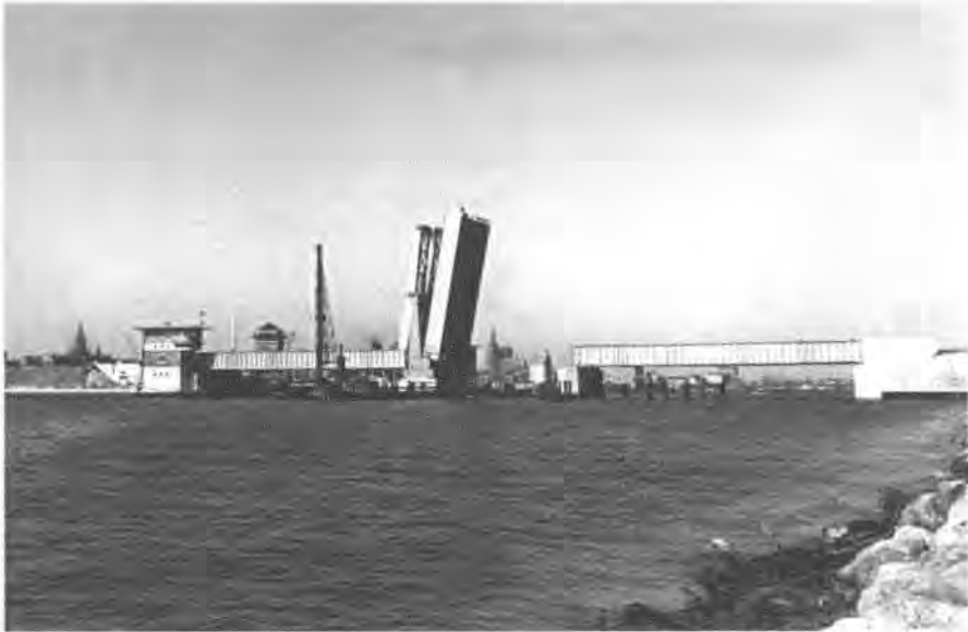
Die geöffnete Ziegelgrabenbrücke 1936.