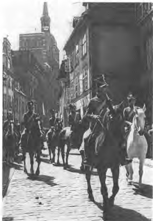
Schill-Husaren auf dem Festzug 1959 (Stadtarchiv Stralsund, Fotoslg. VIII L.s-092a).

listischen Bruderstaatenfamilie zielte die Sozialismus-Präsentation vor allem in zwei Richtungen: Zum einen nach Skandinavien, wobei vorbereitend diskutiert werden sollte, wie es „um den sogenannten ‚schwedischen Sozialismus‘“ stehe und „welche historischen Verbindungen es von Stralsund zu den skandinavischen Ländern“ gebe. 282 Zum anderen waren „gesamtdeutsche“ Gespräche zu organisieren. Westdeutsche Besucher sollten vom positiven Beispiel der DDR überzeugt werden, Projekte wie der im Bau befindliche Rostocker Überseehafen als „Beispiele und Perspektive für ganz Deutschland“ herausgestellt werden. Ziel war es, 450 Arbeiter, Mitglieder und Funktionäre der SPD und der Gewerkschaften aus der Bundesrepublik einzuladen, so der Beschluss der SED-Kreisleitung am 28. Februar 1959. Dies werde „mit dazu beitragen die nationale Frage des deutschen Volkes schneller zu lösen.“ 283 Eine „bevorzugte Versorgung der Objekte für Ausländer etc.“ sollte einen positiven Eindruck der Gäste zusätzlich fördern. 284