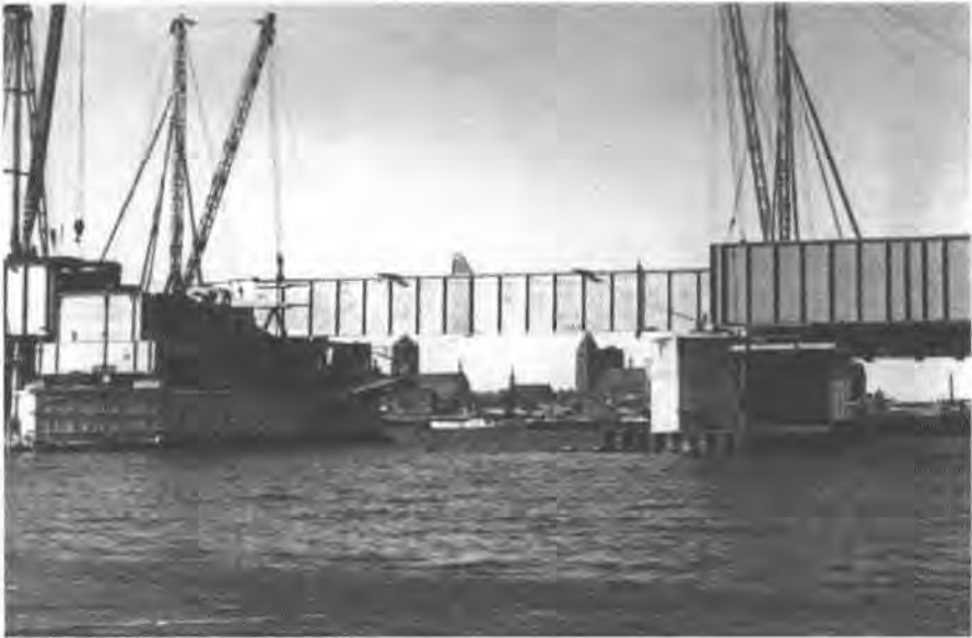
Bauarbeiten an der Strelasundbrücke.

hen“ werde. „Tausende von Händen werden sich dem Beschauer entgegenstrecken und nicht mehr werden es einzelne Namen sein, die mit dem Werk verbunden sind, sondern eine Volksgemeinschaft.“ 237