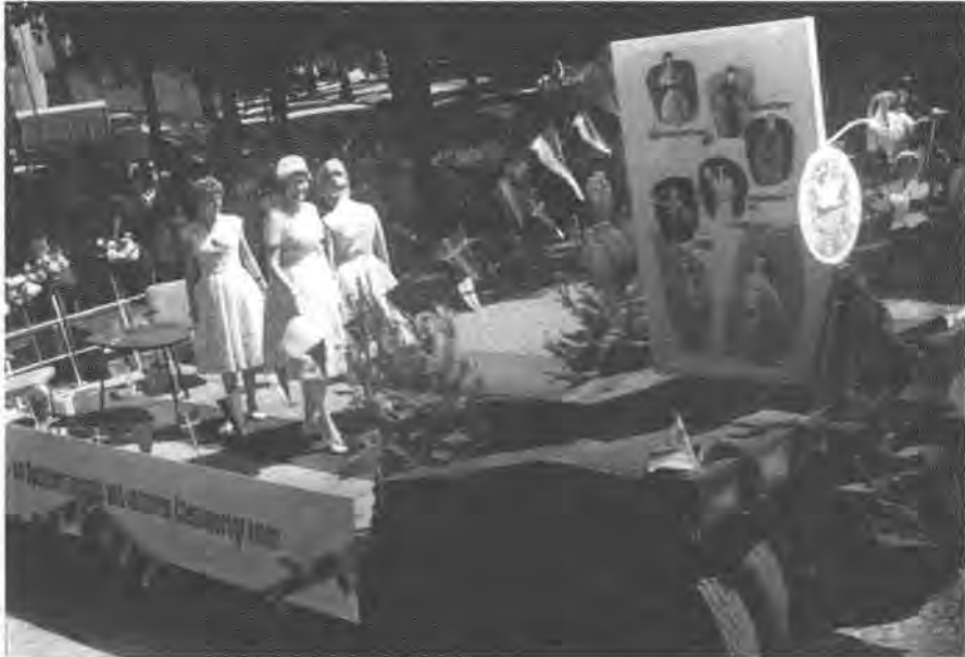
HO-Textilien, Schauwagen auf dem Festzug 1959.