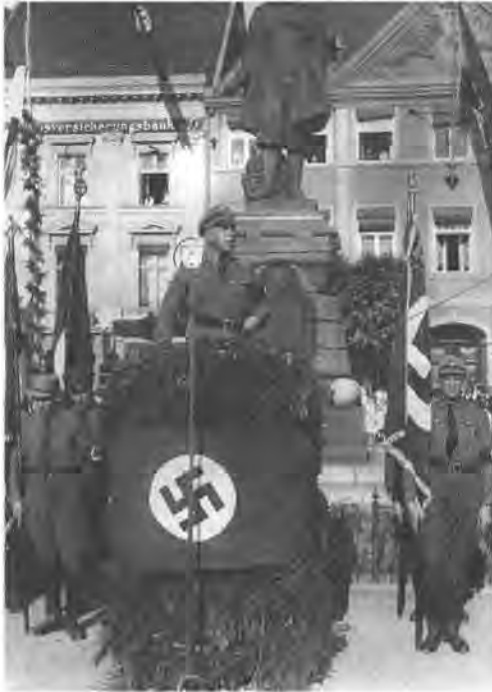
Gauleiter Karpenstein am Schill-Gedenktag, 1934