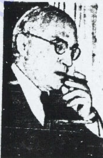
Dr. Heinrich Brüning, Reichskanzler a. D.