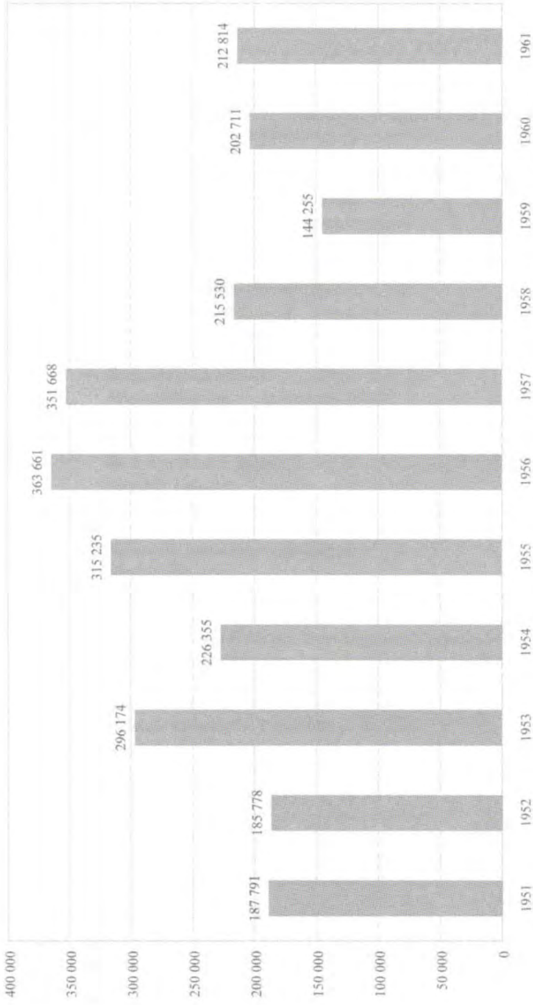
Grafik 2 Jährliche Abwanderung nach Westdeutschland und West-Berlin