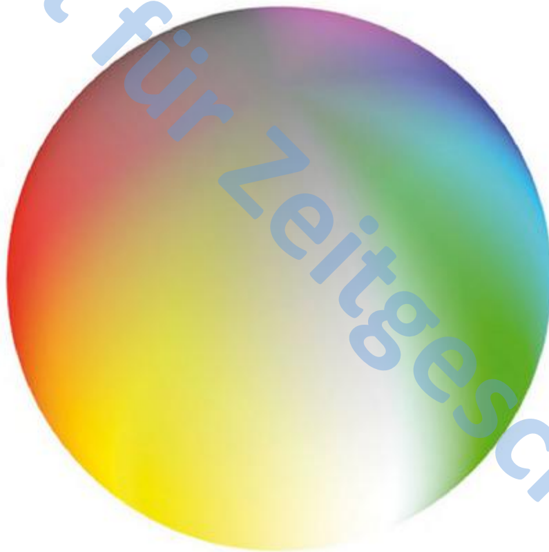
Abb. 2: Weltformel als Farbkugel nach Johann Heinrich Ziegler. Farbenring und -kugel wurden für den vorliegenden Beitrag nach Zieglers verbalen Beschreibungen rekonstruiert. Für die dreidimensionale grafische Realisation danke ich Thomas Purgand von der Agentur AGKD (Halle) – www.agkd.de .