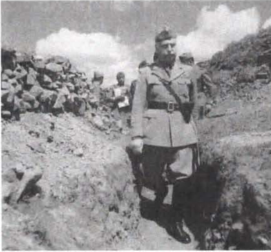
Abb. 10: Ostfront – Generaloberst Gariboldi an der Front, Juli 1942.

Der 1891 geborene General von Tippelskirch war auf den ersten Blick eine ausgezeichnete Wahl. Er sprach neben Englisch und Französisch auch sehr gut Italienisch und hatte zwischen 1938 und 1941 als Oberquartiermeister IV im Generalstab des Heeres fungiert, wo ihm unter anderem auch die Abteilung Fremde Heere West unterstanden hatte. Der General kannte das königliche Heer also besser als die meisten seiner Kollegen, und er hatte zudem 1941/42 als Kommandeur der 30. Infanteriedivision die Erfahrungen im Krieg gegen die Sowjetunion sammeln können, die er nun an seine italienischen Kollegen weitergeben sollte 241 . Andererseits war von Tippelskirch überaus ehrgeizig, von sich ebenso überzeugt wie von der Überlegenheit der eigenen Streitkräfte, und er überschritt in seinem Eifer, die Verbündeten auf Fehler und Versäumnisse aufmerksam zu machen, immer wieder jene imaginäre Grenze, die vom feinen Ehrgefühl der italienischen Offiziere gezogen wurde. Zusammenstöße mit dem Oberbefehlshaber der 8. Armee, Generaloberst Italo Gariboldi 242 , der anstatt Messe mit dem Oberkommando betraut worden und schon als Oberbefehlshaber in Nordafrika an Erwin Rommel gescheitert war, konnten nicht ausbleiben, und es ist kein Zufall, daß gerade er bittere Anklagen gegen von Tippelskirch erhob 243 , der den Oberbefehlshaber immer wieder unter Druck gesetzt hatte.