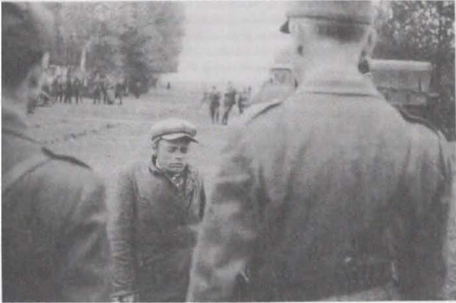
Abb. 3: Ostfront – Befragung eines russischen Partisanen, Juni 1942.

sei prompt und mit Repressalien von beispielhafter Strenge zu beantworten, wobei Geiseln zu nehmen und im Ernstfall als Vergeltung zu erschießen seien 164 .