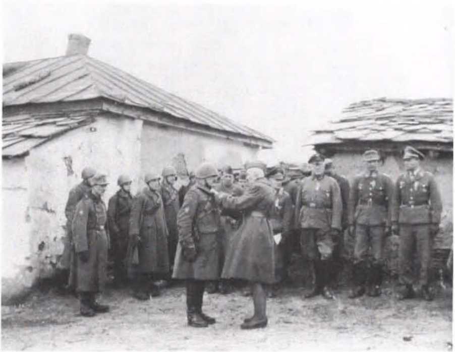
Abb. 8: Ostfront – Verleihung von Tapferkeitsauszeichnungen an italienische und deutsche Offiziere und Soldaten, April 1942.

einer gewissen Voraussicht beim Umgang mit den Wirtschaftsgütern in den besetzten Gebieten würde nicht eingesehen 221 .