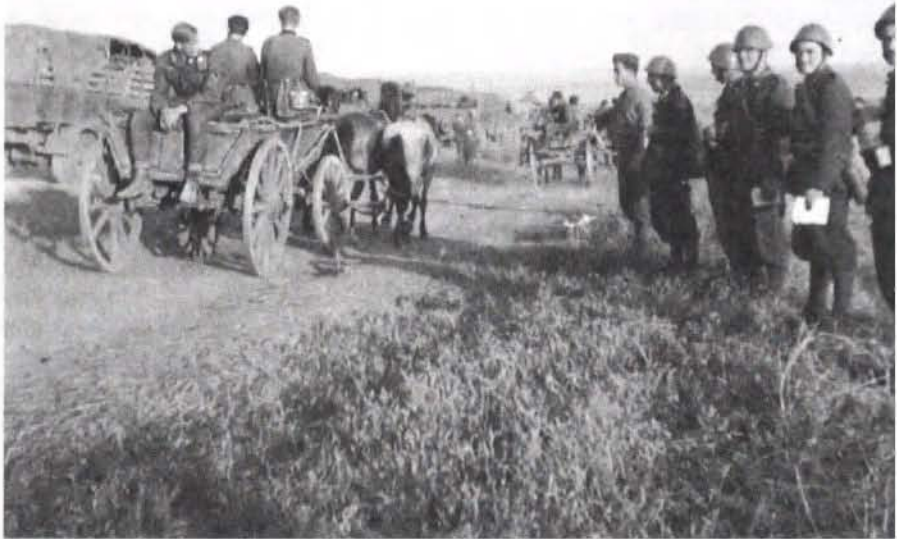
Abb. 1: Ostfront – Begegnung mit einer deutschen Division, August 1941.

Jedes Urteil über die italienischen Truppen, die im Sommer 1941 an die Ostfront verlegt wurden, ist stark vom gewählten Vergleichspunkt abhängig. Für gewöhnlich werden die in der Regel besser ausgestatteten, besser bewaffneten, besser ausgebildeten und wohl auch besser geführten Divisionen der Wehrmacht zu solchen Vergleichen herangezogen, wobei man vor allem in Italien noch heute an einen motorisierten und gepanzerten Moloch denkt, wenn von Hitlers Armeen die Rede ist, ohne darüber nachzudenken, daß dieses Bild nicht zuletzt auf der die Realität stark verzerrende Kriegspropaganda des Dritten Reiches beruht 80 . Vergleicht man das Expeditionskorps mit den Panzerdivisionen und motorisierten Infanteriedivisionen des deutschen Heeres, deren Anteil jedoch nur zwischen zehn und zwanzig Prozent lag, schneidet es zweifellos schlecht ab. Nimmt man jedoch die normalen Infanteriedivisionen als Maßstab, so liegen die Dinge weniger klar, zumal diese Perspektive