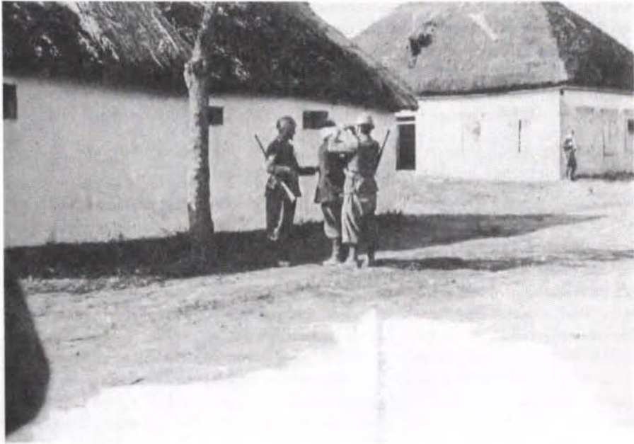
Abb. 6: Ostfront – Exekution eines Gefangenen, Oktober 1941.

„Die unseren sind wütend, weil die Russen unsere Gefangenen martern. Die beiden wurden 10 Meter auf die Wiese geführt, und man hörte den trockenen Schuß eines Karabiners. Einer fiel ohne zu klagen. Ein weiterer Schuß. Der zweite – nicht gut getroffen – begann, mitleiderregend zu schreien. Ein dritter Schuß, und alles kehrte zur ursprünglichen Stille zurück.“ 199