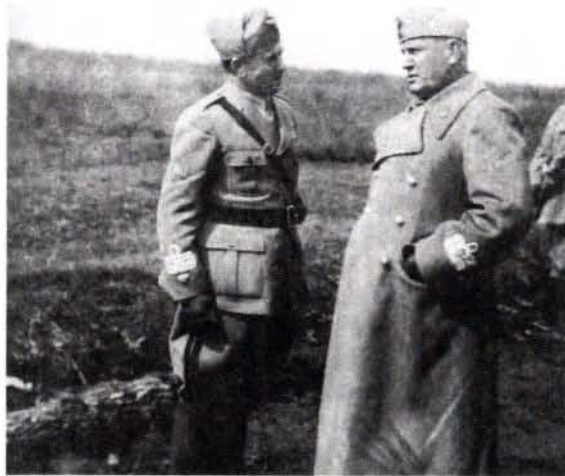
Abb. 2: Ostfront – General Messe und Benito Mussolini während der Reise des „Duce“ in die Ukraine, August 1941.

In den nächsten Monaten tat sich im Abschnitt des CSIR nicht viel. Der härteste Gegner war der russische Winter, den die italienischen Einheiten nicht zuletzt aufgrund der mit über 12 000 Fällen von Erfrierungen bitter erkaufte Erfahrungen im Krieg gegen Griechenland 1940/41 vergleichsweise gut meisterten 97 . Größere Operationen fanden dagegen weiter nördlich im Raum Isjum statt, wo das italienische Generalkommando den dringenden Bitten der Verbündeten nachkam 98 und die deutschen Truppen zwischen Januar und Juni 1942 mit rasch zusammengestellten taktischen Kampfgruppen für Sicherungsaufgaben sowie für defensive wie offensive Kampfaufträge unterstützte.