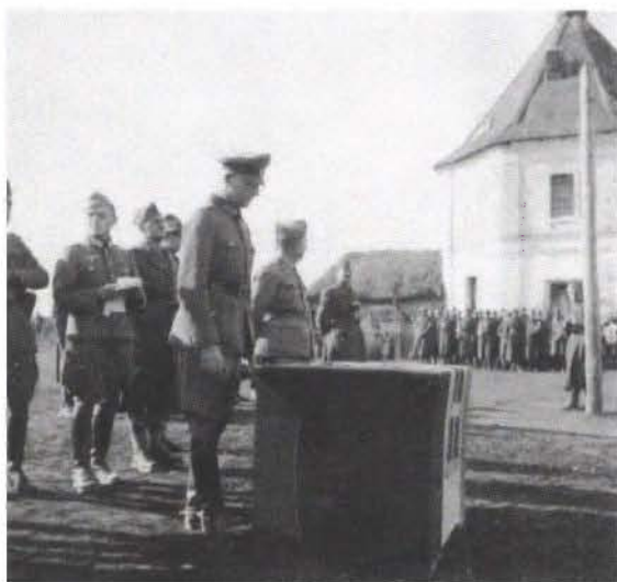
Abb. 9: General der Infanterie von Tippelskirch bei der Verleihung des Eisernen Kreuzes an Offiziere und Soldaten der Infanterieregimenter 79 und 80 der Division „Pasubio“, November 1942.

militärische Lage im Abschnitt des XXXV. Armeekorps ließ sich bis Anfang September stabilisieren; die bündnispolitische blieb dagegen angespannt.