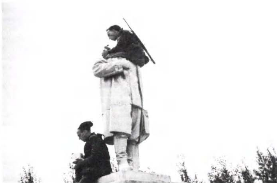
Abb. 5: Ostfront – Schwarzhemden der Legion „Tagliamento“ verzehren ihre Ration auf einer zerstörten Statue von Josef Stalin, Juli 1942.