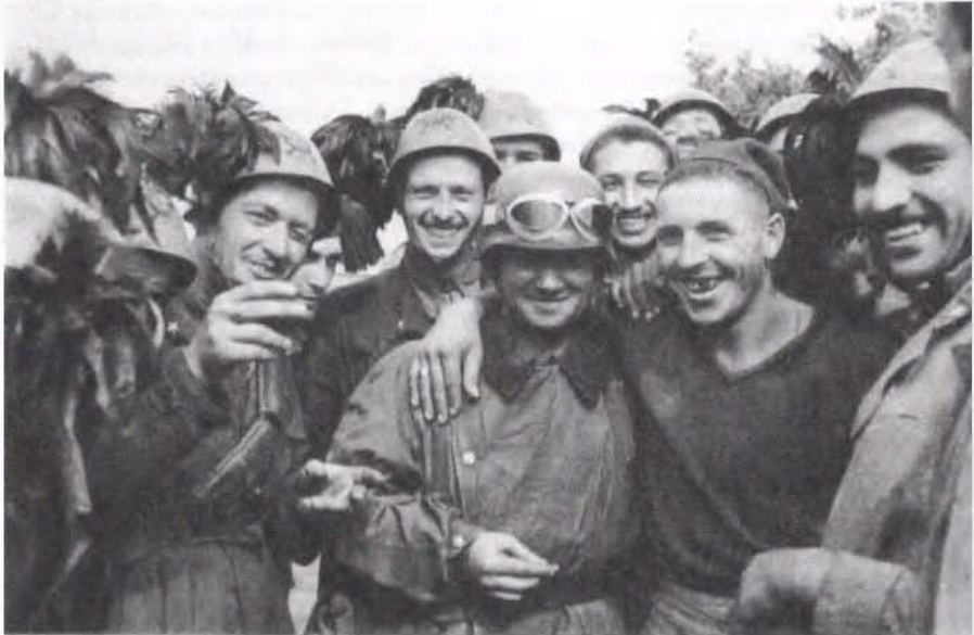
Abb. 7: Ostfront – Bersaglieri verbrüdern sich mit deutschen Soldaten, August 1941.

Beförderungen, Aufmerksamkeiten zu nationalen Gedenktagen oder Huldigungen an kommandierende Offiziere waren daher so etwas wie ein Barometer, an dem sich die deutsch-italienische Wetterlage an der Ostfront ablesen ließ. Freilich begab man sich hier ohne gewisse Kenntnisse der Sprache, der Gebräuche und der militärischen Kultur des Bündnispartners auf vermintes Terrain, konnte die falsche Wortwahl oder auch nur die falsche Tonlage doch alles verderben. Ausgesprochen sensibel war in dieser Hinsicht General Messe, der zwar mit seinen Vorbehalten gegen die Deutschen nicht hinter dem Berg hielt, aber nicht genügend Auszeichnungen und Belobigungen der mächtigen Waffenbrüder sammeln konnte 214 . Im Januar 1942 ordnete er sogar an, die eingehende Korrespondenz daraufhin zu prüfen, ob sich die Deutschen einer angemessenen Form befleißigt hätten, und dementsprechend getrennte Ablagen zu führen 215 .