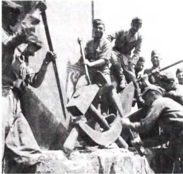
Abb. 4: Ostfront – Infanteristen der „Sforzesca“ zerstören in Krasnyj sowjetische Symbole, August 1942.