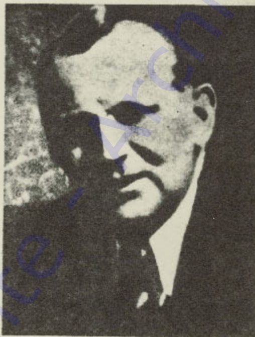
Mierendorff, eine führende Persönlichkeit der Linken.

Auch nach der „Machtergreifung“ setzte Mierendorff seinen Kampf gegen das Hitler-Regime zunächst mit legalen Mitteln fort. Er gehörte