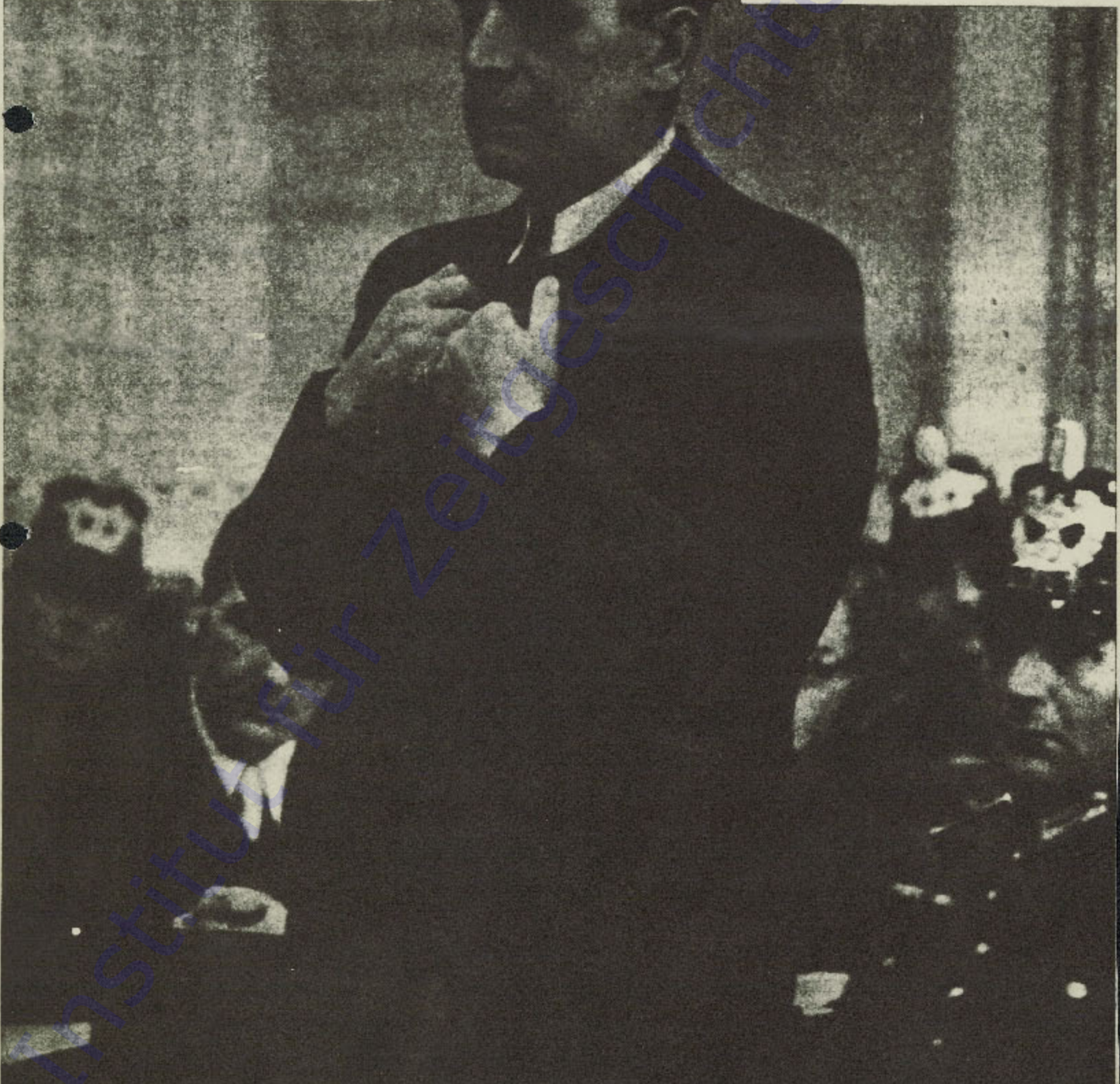
Julius Leber vor dem Volksgerichtshof.