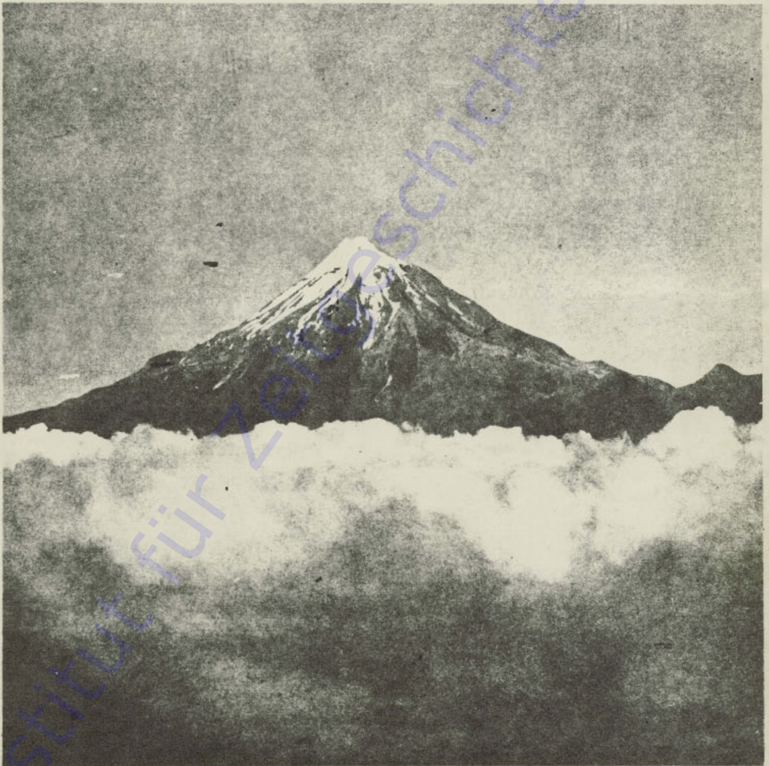
Aus dem Wolkenmeer erhebt sich in majestätischer Einsamkeit der Gipfel des Mount Egmont auf der Nord-Insel von Neu-Seeland. Er ist 2.500 Meter hoch.

Mit der Vollstreckung dieses Urteils am 24. Januar 1945 ist Helmuth von Moltke nicht nur ein Opfer des Hitler-Regimes, sondern zu einem der Märtyrer edelster menschlicher Gesinnung geworden.