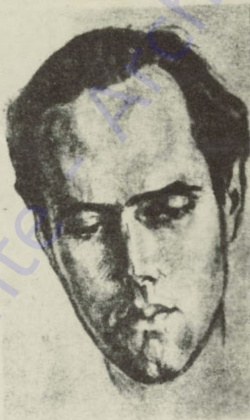
Helmuth James von Moltke (1906-1945)

Während der Zeit des aufkommenden Nationalsozialismus war Moltke als Gerichtsreferendar in der Ausbildung tätig. Der Verbreitung der nationalsozialistischen Ideologie, ihren politischen Phrasen und Versprechungen begegnete er mit dem Vorbild einer strengen Lebenshaltung und -führung und mit der praktischen Verwirklichung seiner eigenen Ideen und Pläne. Er rauchte nie und trank nur gelegentlich Alkohol. Er arbeitete intensiv und gründlich, aber ohne sich dadurch besonders zu verbrauchen. Als grösste Gefahr für eine Steigerung der politischen Radikalisierung in Deutschland erkannte er frühzeitig die seit dem Jahre 1930