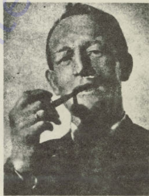
Adolf Reichwein fiel einem feigen Verrat zum Opfer