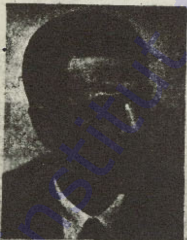
Die letzte Aufnahme vor der Verhaftung.