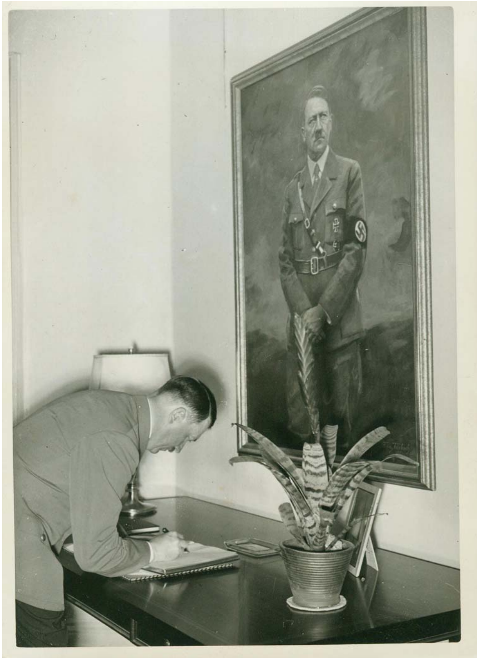
Ein Abdruck dieses Bildes findet sich auch im Mitgliederverzeichnis des Nationalen Klubs vom Oktober 1940