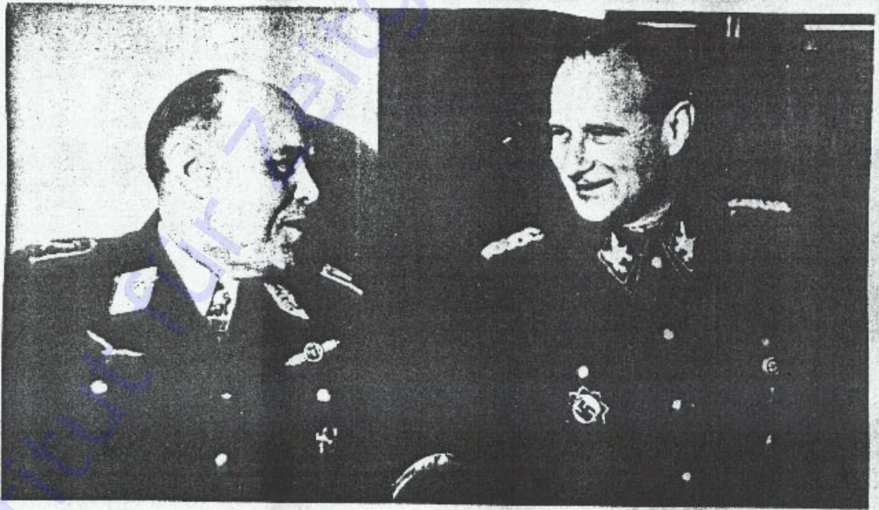
Il maresciallo Alberto Kesselring a colloquio con il generale Wolff.