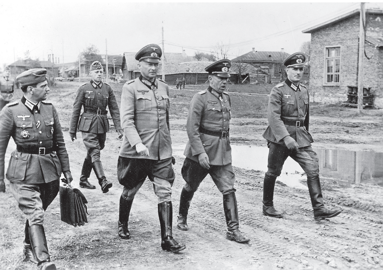
General der Infanterie Gotthard Heinrici (2. von rechts) mit Generalfeldmarschall Günther von Kluge, Oberbefehlshaber der Heeresgruppe Mitte, im Hauptquartier der 4. Armee in Spas-Demensk am 1. Mai 1942. Links: Oberstleutnant i.G. Hellmuth Stieff, I. Generalstabsoffizier (Ia) der 4. Armee. Rechts: Major i. G. Erich Helmdach, 3. Generalstabsoffizier (Ic) der 4. Armee.