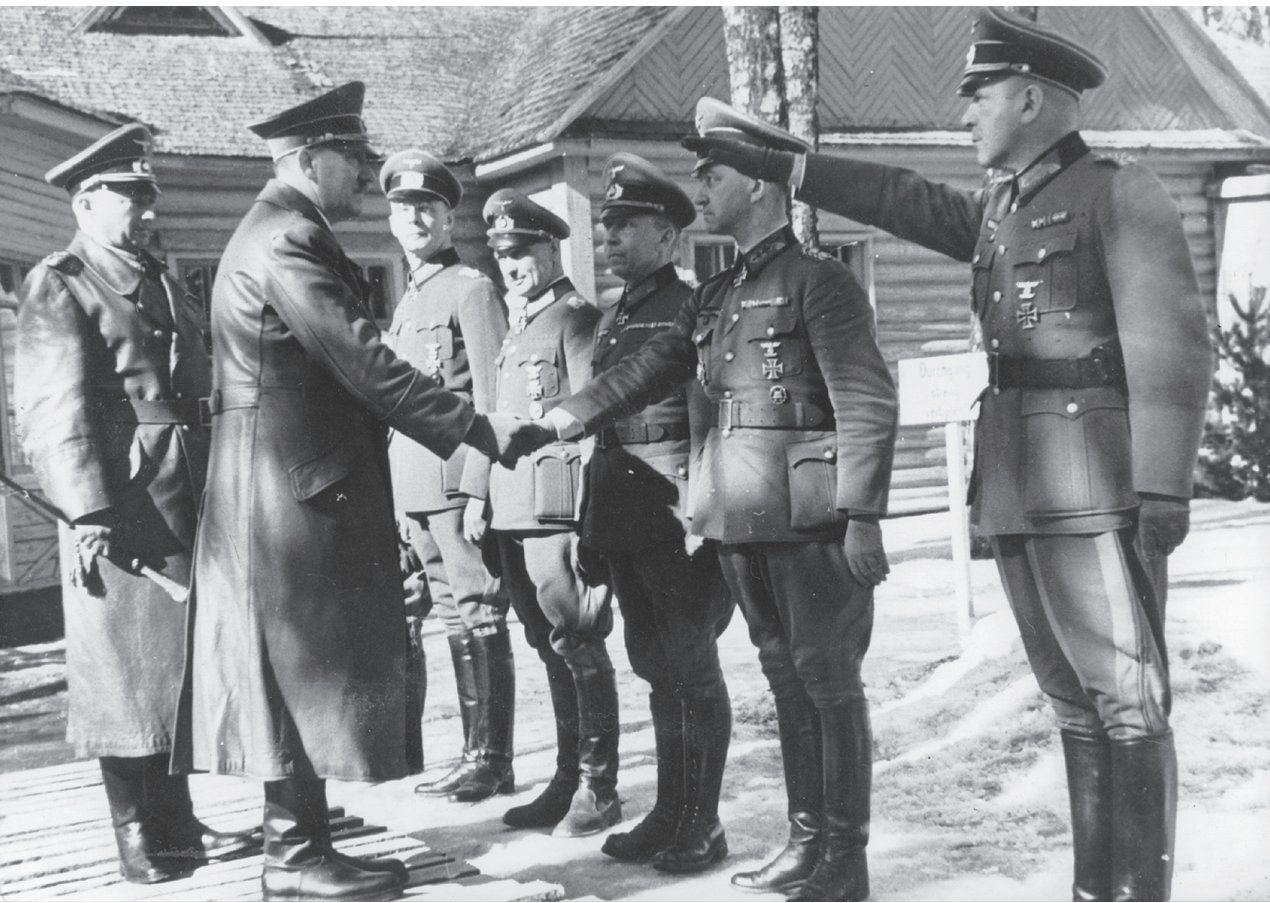
Generalfeldmarschall Günther von Kluge stellt Adolf Hitler am 13. März 1943 im Hauptquartier der Heeresgruppe Mitte bei Smolensk die Armeeoberbefehlshaber der Heeresgruppe vor: (von links) Generaloberst Hans-Georg Reinhardt (3. Panzerarmee), Generaloberst Walter Model (9. Armee), Generaloberst Gotthard Heinrici (4. Armee), General der Infanterie Walther Weiß (2. Armee). Rechts: Generalmajor Hans Krebs, Chef des Generalstabs der Heeresgruppe Mitte.